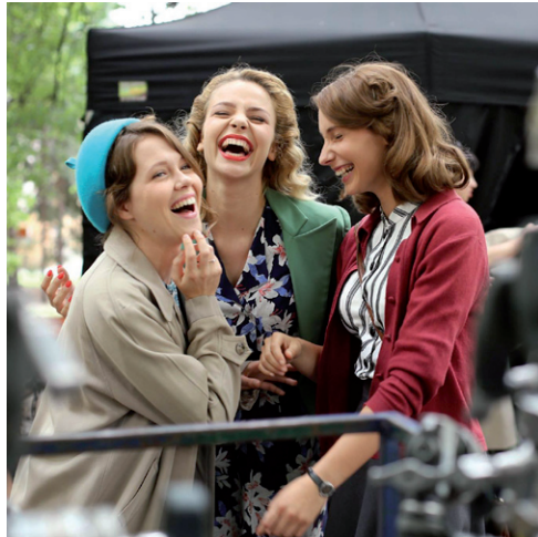
„Morowe panny” – materiały prasowe Akson Studio

filmowych i telewizyjnych w Polsce. W dorobku firmy są takie produkcje, jak seriale m.in. „Czas honoru”, „Bodo”, „Oficer” czy filmy „Katyń”, „Waleśa. Człowiek z nadziei” i inne. Lublin jest dla filmowców atrakcyjnym miastem – mamy piękną starówkę nieoszczędzoną reklamami, z ciekawymi