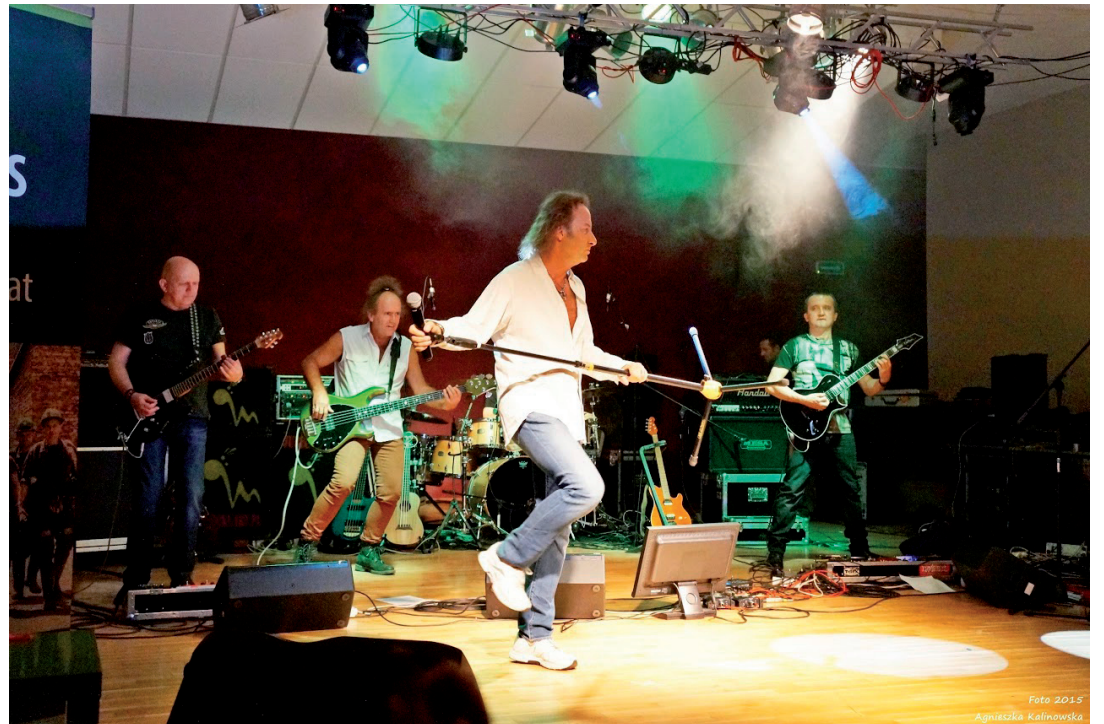
Pierwsza edycja festiwalu okazała się wielkim sukcesem

– W „Andaluzji” dobra muzyka gości bardzo często a publiczność to docenia