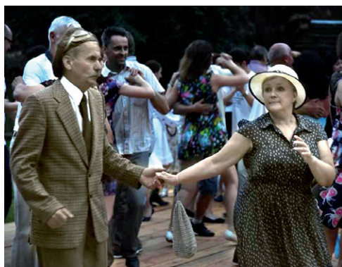
Na osoby, które przyjdą w strojach „z epoki”, czekają rabaty

Muzeum Wsi Lubelskiej zaprasza 6 sierpnia na godzinę 19.00 na retro potańcówkę. Osoby, które przyjdą w strojach „z epoki”, za bilety zapłacą tylko 6 zł. Cena dla pozostałych to 12 zł. Wejście przez recepcję i kasę w godzinach 19.00-22.00. Zabawa w prowincjonalnym stylu wśród świateł lampionów ma potrwać do północy. To tańca przygrywać będą lubelskie zespoły: „Hań-