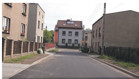
Remont nawierzchni ulicy Demarczyka