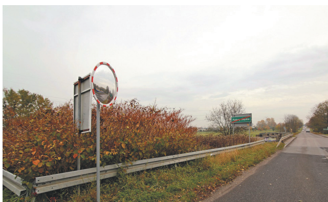
Montaż lustra drogowego na Józefce