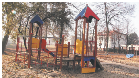
Modernizacja Placu zabaw „Bąbel”