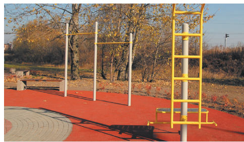
Ruch pod chmurką