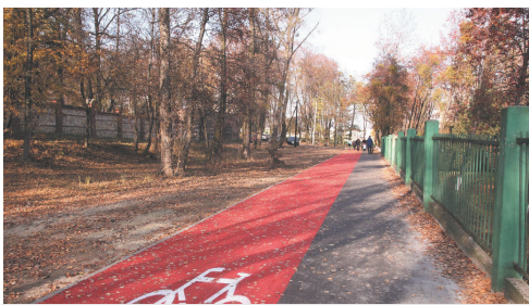
Budowa chodnika wzdłuż muru cmentarnego