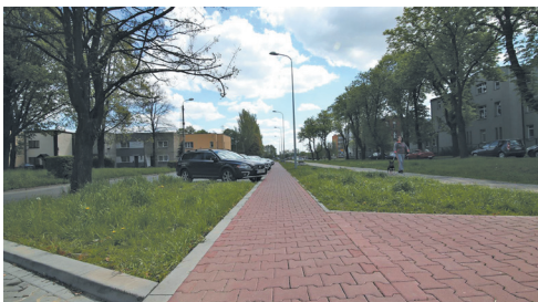
Parking i chodnik przy ulicy Stefana Okrzei