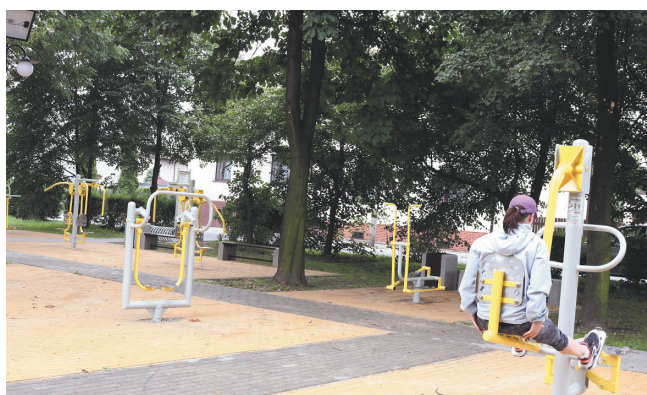
Siłownia pod chmurką na ul. Sikorskiego