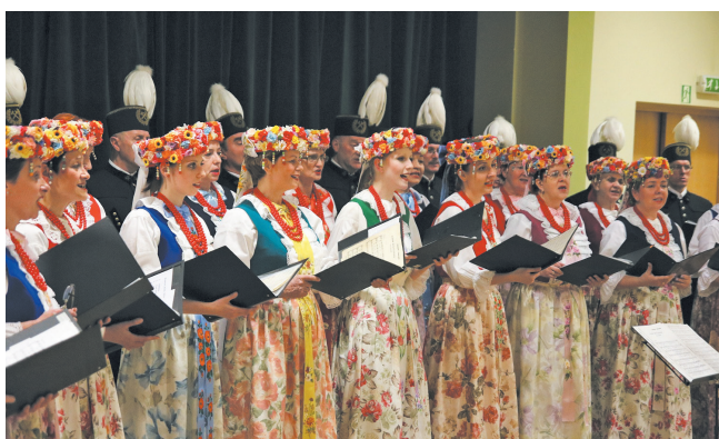
Obchody jubileuszu 105-lecia istnienia Chóru „Halka”

· możliwość realizacji w ciągu roku, · zgodność z kompetencjami miasta (dzielnic lub jednostek), · zgodność ze strategiami i programami miasta. Projekty, które po przeprowadzeniu analizy, zostaną uznane za możliwe do realizacji trafiają pod głosowanie. Pomysły wybrane przez mieszkańców w głosowaniu zostaną zrealizowane przez Miasto w 2018 r.