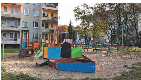
Plac zabaw przy ulicy Rozdzińskiego