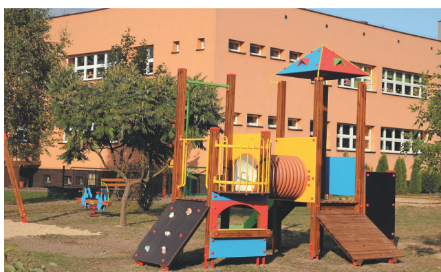
Plac zabaw przy Miejskim Przedszkolu nr 15