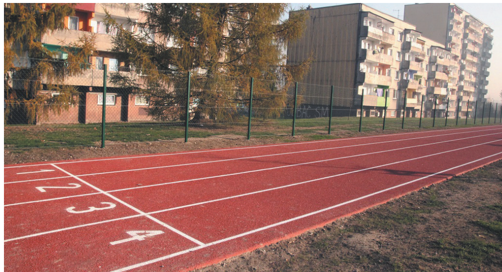
Rozbudowa bazy sportowej na Osiedlu Powstańców Śląskich.